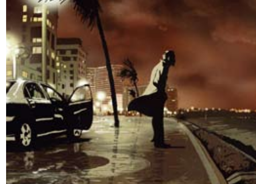
Waltz with Bashir

De kommer från Norra Sverige men lever nu 100 mil söderut. Precis som så många andra finner de inte ro i den stora staden utan längtar åter hemåt. Men det är inte bara en återvisit utan de bestämmer sig för att bygga en trädstuga belägen 14 meter över en vacker äldval. Under den sommar då trädstugan byggs blir de också mer och mer medvetna om Trädets roll i teologi, filosofi och mytologi.