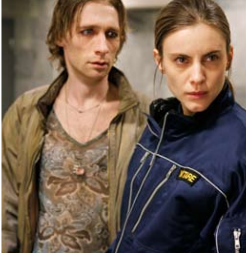
I skuggan av värmen