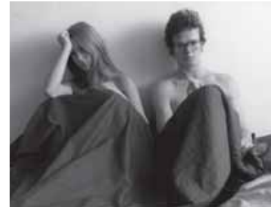
Det sista äventyret